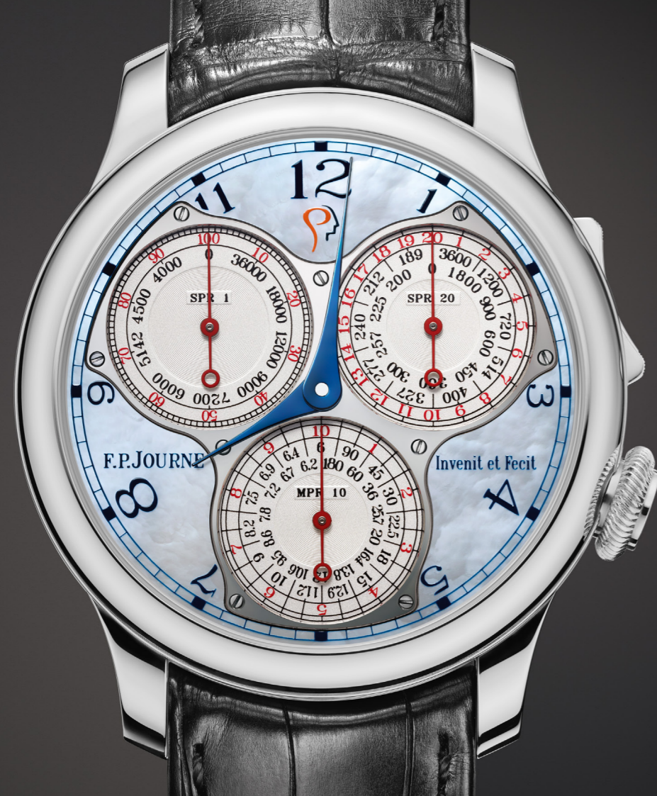
Centigraphe Souverain ICM 2016 Réf. CT

2016 _ Un Centigraphe Souverain unique avec un cadran en nacre bleue, arborant discrètement le logo de l'Institut du Cerveau à 12h, est mis aux enchères lors d'un gala de charité organisé à la Conciergerie de Paris. Le marteau tombe à 120'000 €, une somme qui sera également entièrement donnée à l'Institut.