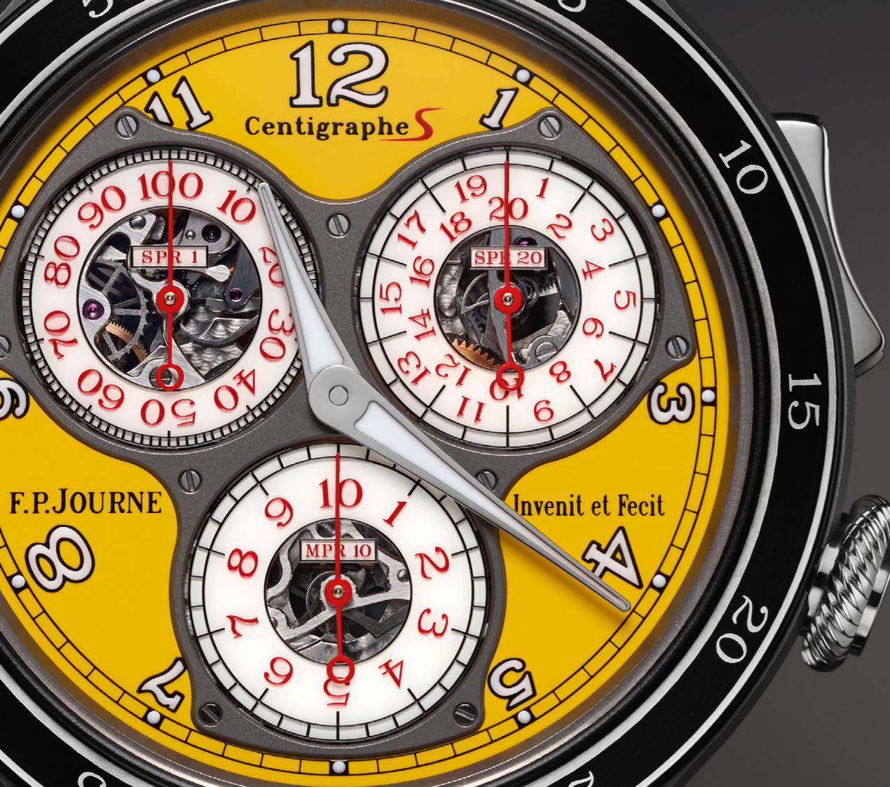
Centigraphe Réf. CTS2